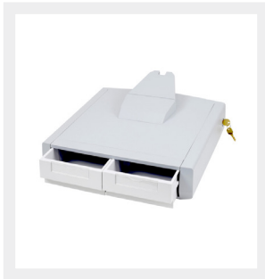
Cerradura con llave (estándar)