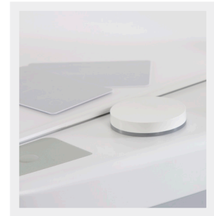
Lector de badges Salto