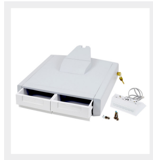
Bloqueo electrónico de números