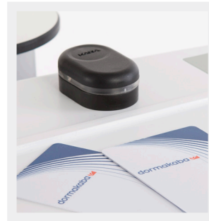
Lector de tarjetas dormakaba